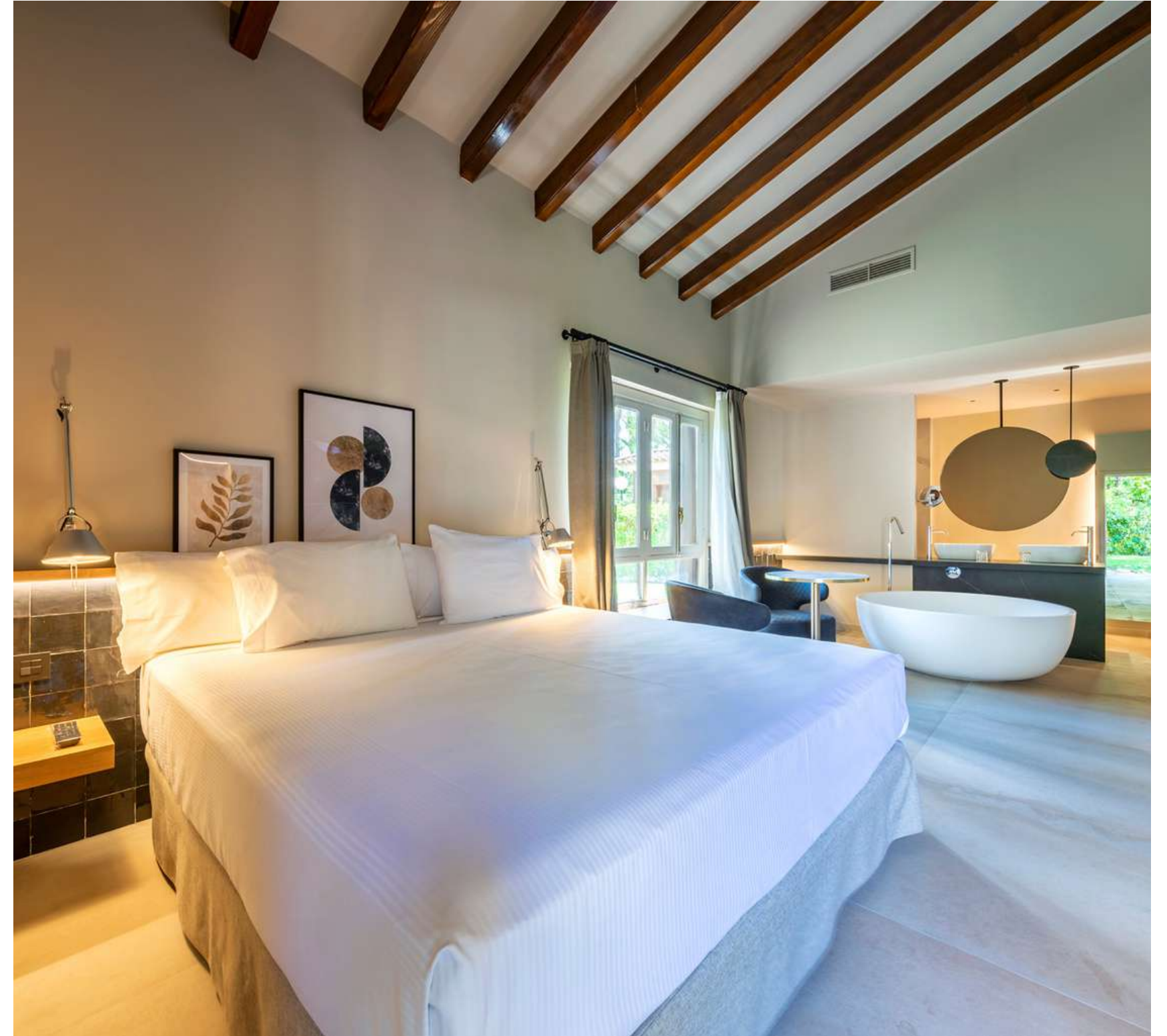
Habitación Junior Suite sujeta a disponibilidad